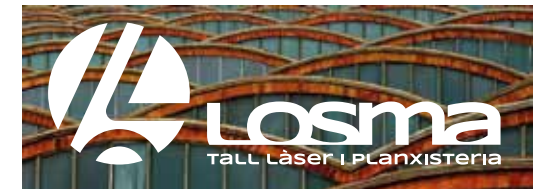
FONS FOTOGRÀFIC COLOR FOSC