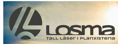
FONS FOTOGRÀFIC COLOR CLAR