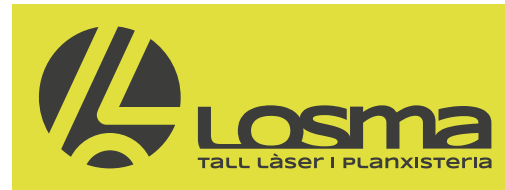
COLOR NO CORPORATIU CLAR