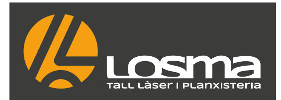
VERSIÓ PRINCIPAL FONTS FOSC