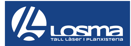
COLOR NO CORPORATIU FOSC